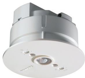
LRM1070/00 SENSr MOV DET ST