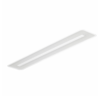
IPPR SM480Ci 0001