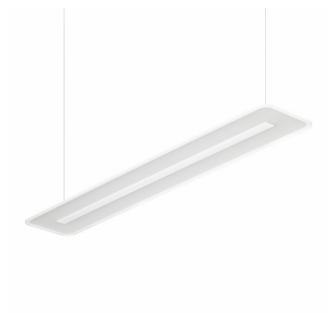
SmartBalance Suspended Mounted - LED Module, system flux 3500 lm