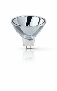
XPPR XHOPDI 0002