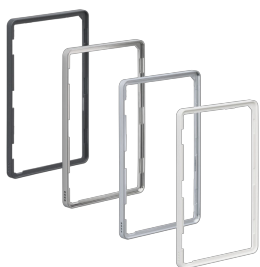
Different RIM colors EU