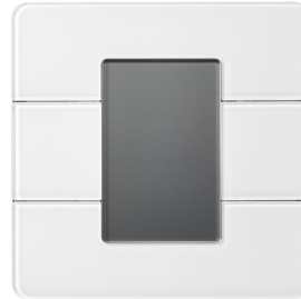
PADPE AntumbraDisplay EU White - Front