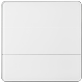
PATPE AntumbraTouch EU White - Front