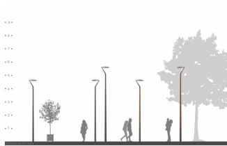
2D rendering CitySoul gen2 Bracket - Lyre