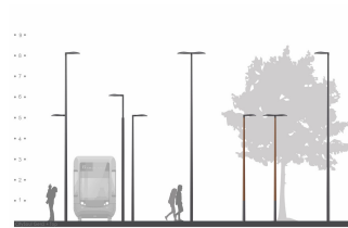
2D rendering CitySoul gen2 Bracket - Top