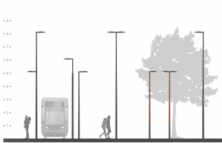
2D rendering CitySoul gen2 Bracket - Top