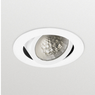
LuxSpace Accent Compact G3 - LED Module, system flux 1700 lm