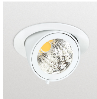
LuxSpace Accent Compact G3