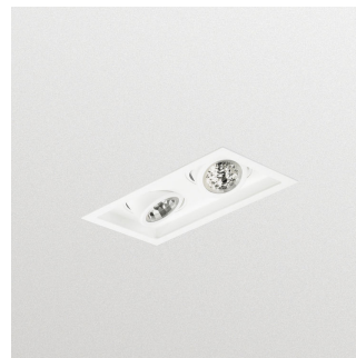
StoreFlux GD602B LED-Einbaustrahler mit Einfassung