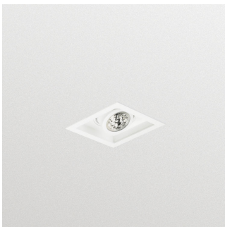
StoreFlux GD601B LED-Einbaustrahler mit Einfassung