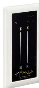
PowerBalance Tunable White, recessed DP