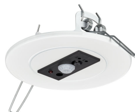
PowerBalance Tunable White, recessed DP