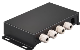
PowerBalance Tunable White, recessed DP