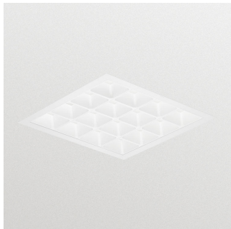
PowerBalance recessed Tuneable WH - - LED Module, system flux 8000 lm