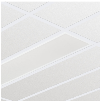
SlimBlend recessed mod. 600