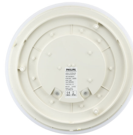
Ledinaire Wall-mounted- WL060V_LED17S-2DPP.tif