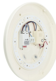
Ledinaire Wall-mounted- WL060V_LED17S_MDU-1DPP.tif