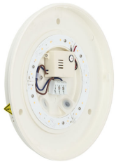
Ledinaire Wall-mounted- WL060V_LED11S-DPP.tif