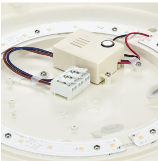
Ledinaire Wall-mounted- WL060V_LED17S-3DPP.tif