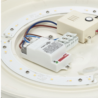
Ledinaire Wall-mounted- WL060V_LED17S_MDU-2DPP.tif