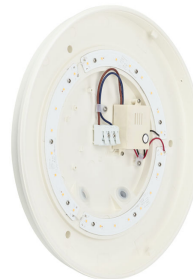
Ledinaire Wall-mounted- WL060V_LED17S-1DPP.tif