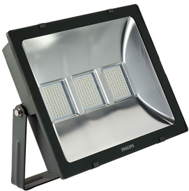
LED Module, system flux 20,000 lm - LED - 100° x 100°