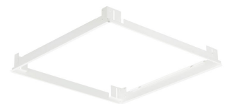
FlexBlend Recessed-RC340B_W60L60_CPC brackets