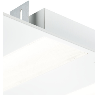
FlexBlend Recessed- RC340B_PCS_DPP