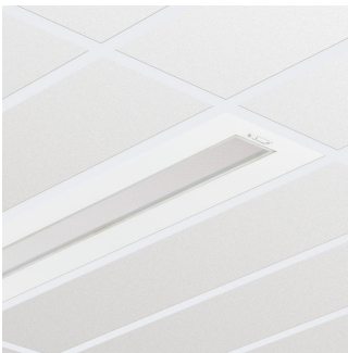
FlexBlend Recessed-RC340B W30L120 MLO VPC