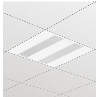
FlexBlend Recessed RC340B W60L60 MLO CPC