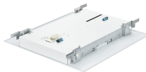
FlexBlend Recessed- RC340B_W60L60_backcover_CP C