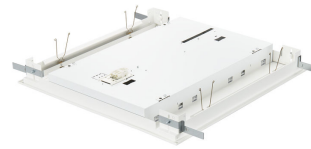
FlexBlend Recessed- RC340B_W60L60_backcover_PC V