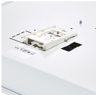
FlexBlend Recessed-RC340B PIP Closed