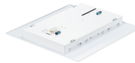
FlexBlend Recessed-RC340B_W60L60_Backcover_VP C