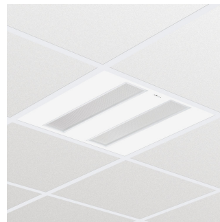
FlexBlend Recessed RC342B W62L62 MLO VPC