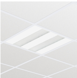
FlexBlend Recessed RC340B W60L60 PCS VPC