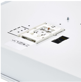
FlexBlend Recessed RC340B PIP Open