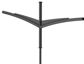
SPLINE BRACKETS - 1200 mm - 60 mm - RAL color