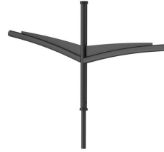
SPLINE BRACKETS - 1000 mm - 60 mm - RAL color