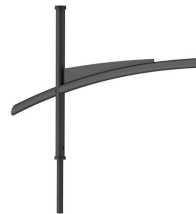
SPLINE BRACKETS - 1200 mm - 60 mm - RAL color