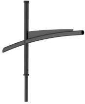
SPLINE BRACKETS - 1000 mm - 60 mm - RAL color