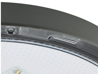
TownTune ASY DR BDP266