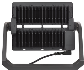
Rear View of BVP517 floodlight (BV : With External Driver Box, Grey painted housing)