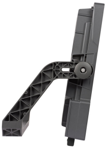
Side View of BVP527 floodlight (BV : With External Driver Box, Grey painted housing)