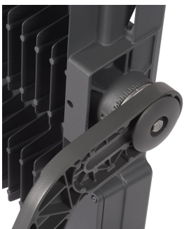
Access Bolt to AIM the BVP527 floodlight easily (Grey painted housing)