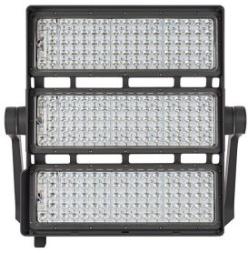
Front View of BVP527 floodlight (Grey painted housing)