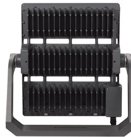
Rear View of BVP527 floodlight (BV : With External Driver Box, Grey painted housing)