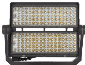
Front View of BVP517 floodlight (Grey painted housing)