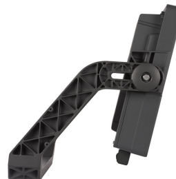
Side View of BVP517 floodlight (BV : With External Driver Box, Grey painted housing)